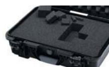
Calages de mousse cubique