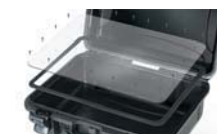
Ensemble de panneau étanche