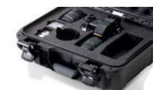
Mousse coupée sur mesure